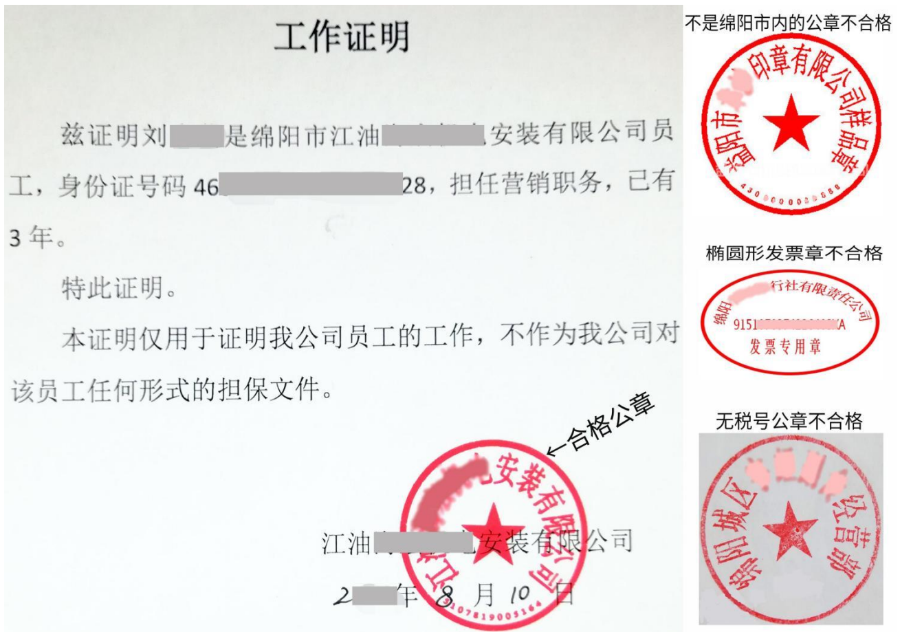
图 2-4-2 工作证明中的公章要求