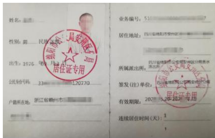
图 2-4-3 居住证（小册子）